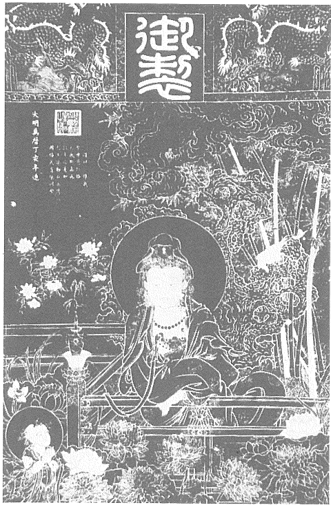
◎九蓮菩薩的信仰，因有萬曆皇帝的推動，李太后因此由凡夫搖身一變成爲菩薩。

萬曆的母親李太后也曾被觀音夢授《九蓮菩薩經》。因緣是在一五八六年七月初七，李太后住的慈寧宮忽然有瑞蓮盛開，兩天後皇宮裡也有瑞蓮盛開。李太后曾命宦官兩次捧觀音像到普陀山進香，因為觀音乃胎藏界的蓮華部主，次年她就作夢被授《九蓮菩薩經》。