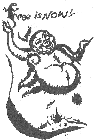
(泰國解脫自在園心靈樂園壁畫)