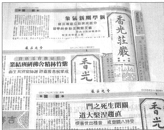
◎1985年創刊，《香光莊嚴》以對開報紙與大家見面。（本刊資料照片）

一、新聞：剛開始幾期的新聞，多以香光尼眾佛學院和香光尼僧團等道場的活動報導為主，也有佛教界其他活動訊息。但到後來，新聞報導愈見式微，一是因為季刊發行的時間，很