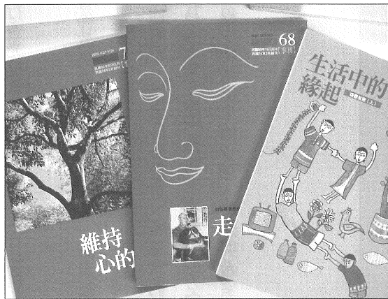
◎1996年至今，《香光莊嚴》以雜誌書的製作為方向，提供更多更完整的佛法內涵。

《香光莊嚴》雜誌雖在版型與專欄上不斷改變，但所懷抱的理想——關懷佛教教育，共創人間淨土——一直沒有改變過，猶如《香光莊嚴》刊名的由來，那是取自《大佛頂首楞嚴經·大勢至菩薩念佛圓通章》：「……十方如來，憐念眾生，如母憶子。若子逃逝，雖憶何為？子若憶母，如母憶時，母子歷生，不相違遠。若眾生心，憶佛念佛，現前當來，必定見佛，去佛不遠。不假方便，自得心開。如染香人，身有香氣，此則名曰香光莊嚴。我本因地，以念佛心，入無生忍。今於此界，攝念佛人，歸於淨土。佛問圓通，我無選擇。都攝六根，淨念相繼，得三摩地，斯為第一。」在人間生活，雖然會有許多不圓滿，但若常能親近佛法，心心念念在法上，薰染佛陀的法身香，激發自己的智慧光，讓這光亮在他的生命裡，相互扶持與滋潤，這不就是「香光莊嚴」嗎？而香光尼僧團一直致力於佛教教育的推廣，不斷地透過教育、出版，讓所有的人都有薰染佛法的機會，而辦雜誌傳遞法音，不只《香光莊嚴》一份雜誌，民國八十四年，香光尼眾佛學院圖書館出版