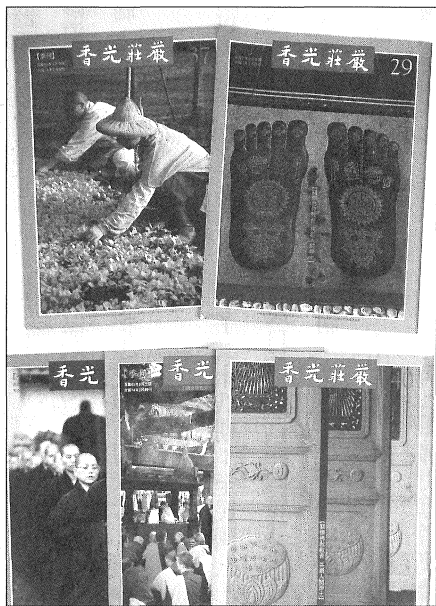
◎1992年至1996年，《香光莊嚴》改以十六開的雜誌發行。

三、湧泉之歌：佛法落實在人間，貼近著人間生活，在佛教的修行體驗中，有含頤的微笑，也夾雜著情緒高亢的爭辯，還有自責的慚愧、懺悔。隨著參學空間的擴大和活動項目的多元，修行體驗的觸角