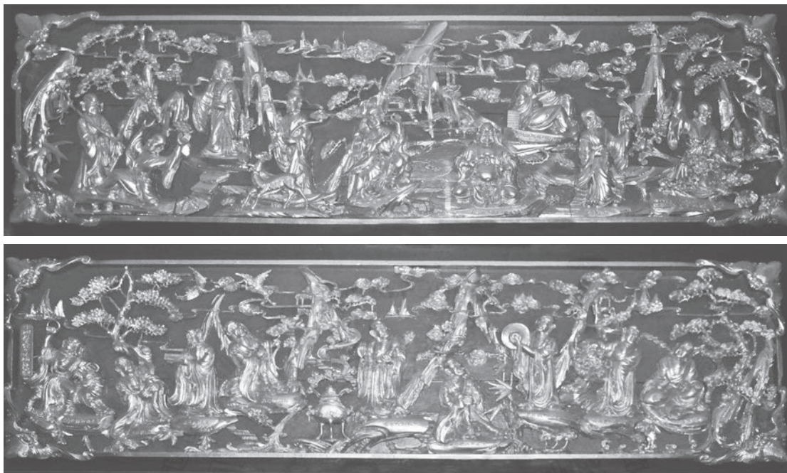
圖七：東初禪寺十六羅漢木刻人物群像

除監院外，並有常住僧侶常諦等十餘位，每周均密集的舉辦固定活動。其中週一至週四晚間活動，週一為「念佛共修法會」，除稱念佛號自修外，也有為人助念與祈福的活動，此有念佛會員之組織，全名曰：「法鼓山東初禪寺福慧念佛會」。參與此法會的信眾，多為華人，也有少數西方人，參與人數達三十餘人，將大殿整個坐滿，座無虛席。