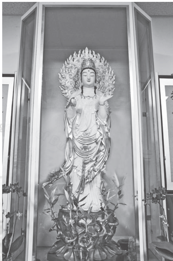
圖三：東初禪寺立姿菩薩像

脫鞋進入禪堂後，便見排列整齊的拜墊成行置滿全堂，盡處是佛龕，供奉教主釋迦世尊，世尊頭上肉髻突起，螺髮罩頂，身上金黃色袍服裹住全身，世尊雙腿結跏趺坐於大形蓮花花托上，雙手結禪定印於腹前。世尊五官圓滿，手足身軀比例勻稱，肌膚厚實，