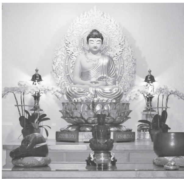
圖四：一樓禪堂主尊釋迦摩尼佛

骨肉亭勻，坐姿挺拔，神情莊嚴，充滿了禪定的神情，而身後的頭光、身光，均以火燄紋圍繞，象徵光明、智慧。佛龕前設供桌，供具法器為香爐、燈具、大磬、木魚等，是最基礎的禪堂擺設。(見圖四)