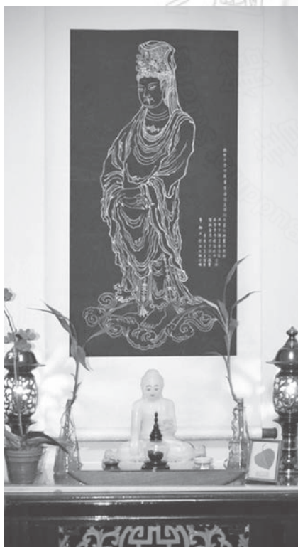
圖八：二樓佛堂吳道子所畫觀音像

其後因參與法會的信徒不斷擴增，而不敷使用。因此曾經想另外買地興建更大道場，但如此一來，道場一分為二，活動難於兼顧，新建道場將脫離紀念東初法師本意。如今經過主事者多年的努力，終於因緣具足，得以屏除了一切障礙，併合旁側與後院之樓房建地，將來四棟樓房打通改建時，地平向左及向後擴增，等於延展舊道場的活動空間，且並未拋棄原地。發展法務時，勢必有另一番嶄新的氣象。🌀