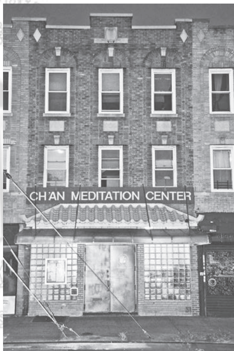
圖二：紐約皇后(Queens)區東初禪寺全寺外觀