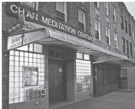
圖一：紐約皇后(Queens)區東初禪寺大門

1978年底聖嚴法師，首次在紐約皇后(Queens)區的林邊(Woodside)地租下一層房子，成立禪中心(Chan Meditation Center)，次年，為紀念師父東初老人，改名稱「東初禪寺」(The Chung-Hwa Institute of Buddhist Culture)。此時雖是道場固定，