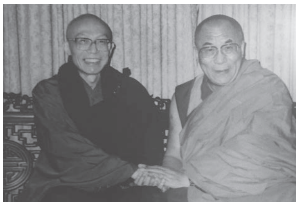
圖六：一樓佛堂牆壁所掛聖嚴法師與達賴喇嘛合照

在簡潔樸實、不事奢華的禪風中，牆面掛著聖嚴法師親手書寫勉勵四眾弟子法語(見圖五)，以及聖嚴法師與達賴喇嘛等高僧合影照片(見圖六)，對牆又懸掛著兩框雕刻品，仔細瀏覽這紅色襯底的木刻人物群像，其主題竟是十六羅漢！在尊者姿勢多具變化中，充滿禪趣。(見圖七)