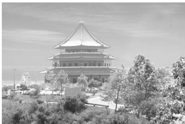
佛光山玫瑰陵建築宏偉，視野遼闊。

全美最大的佛教墓園——佛光山玫瑰陵，座落於洛杉磯玫瑰崗最高處的山頂，是一座一百呎高三層樓的中國宮殿式寶塔，建築宏偉，視野遼闊，能眺望整個洛杉磯美麗的景色。星雲大師啓建玫瑰陵，旨在發揚中國人慎終追遠的孝親美德，讓情義深遠的親情得以延續，並增添多元文化色彩，使各族裔人士得以生前包容，死後相伴，泯除族裔文化的隔閡，展現佛國淨土平等無礙的精神。