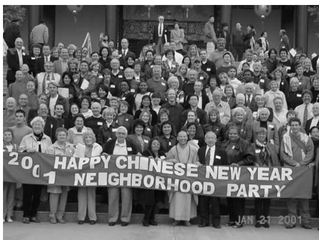
西來寺於每年新春均舉辦「敦親睦鄰」活動，邀請「西來之友」齊聚一堂，聯誼交流。