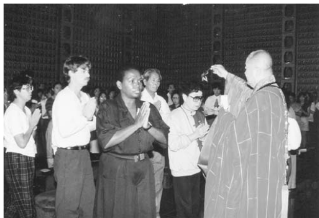
星雲大師主持三皈五戒，西方人士踴躍參加，法嘉充滿。