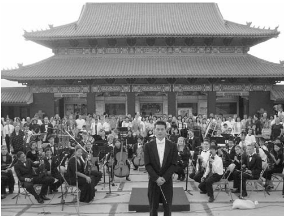
西來寺佛光青少年交響樂團經常至各地公演，獲得好評。

華地區、洛杉磯地區的海華文藝季公演及參與「梵音樂舞文化藝術饗宴」的演出，獲得全場中、美籍人士熱烈喝采。雖有斐然的成績，該團仍不自滿，而且更自期要努力將佛教音樂推向大眾，使梵樂走向世界。今年的美國國慶，特別於洛杉磯西來寺成佛大道舉辦「穿越煙火與你相遇——佛光青少年交響樂團、格蘭朵拉青年交響樂團聯合露天音樂會暨文化藝術饗宴」，吸引了五百餘位南加民眾前來觀賞，其中美籍人士更幾乎佔一半以上。此次結合佛光青少年交響樂團、格蘭朵拉青年交響樂團（Glendora Youth Orchestra）兩個樂團成員，實是一大創舉！佛光青少年交響樂團自一九九三年成立至今，一直是佛教界唯一的交響樂團，除演奏西洋交響樂曲外，更利用西方樂器詮釋佛教歌曲。這次公演首度與團員多為基督教徒的白人的格蘭杜拉青年交響樂團合作，是在種族、宗教融和上的一大突破，加上於國慶日演出，更具有特殊意義。