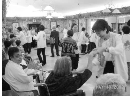
西來寺社會關懷小組為老人帶來歡樂

當館方人員看到這些琳瑯滿目、印刷精美、內容精闢的贈書時，都不禁發出嘖嘖讚歎之聲，對於這些淨化人心之叢書將豐富館藏，一再表示是洛杉磯各階層民眾之福報。尤其在加州州政府財務吃緊，年度圖書館購書預算刪減七百多萬的困頓之際，西來寺的善舉便如同及時甘霖般，潤澤了大洛杉磯地區求法若渴民眾之心靈！