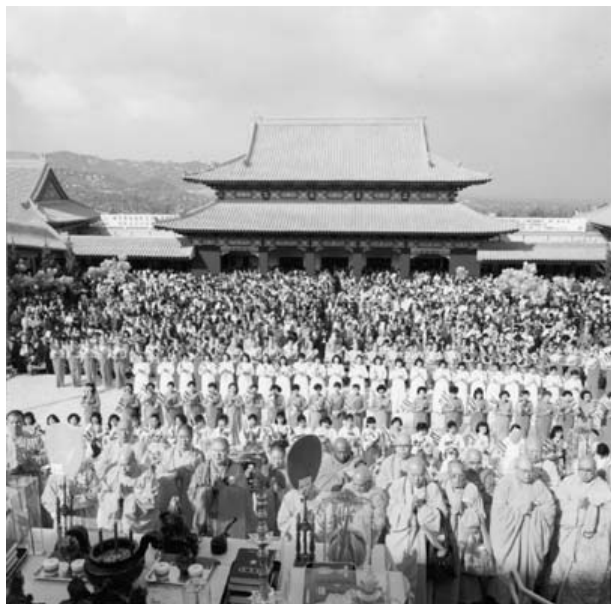
一九八八年西來寺落成典禮

一九八八年十一月二十六日是一個萬人撼動的日子，佛光山西來寺在一萬多位中外來賓的祝福聲中正式落成，成為西半球的第一大寺。從此東方菩提播種於美洲，領導佛教邁向國際化的新里程。十餘年來，在僧信二眾的努力之下，大法西來最重要的「佛教本土化」工作，日漸有成，當初所播之種子，已慢慢發芽，進而開花結果，不禁令人拍手稱慶！其他分布在美洲各地之佛光山道場，也都戮力推動，使學佛在西方國家蔚為一股風氣，居功厥偉！但由於西來寺位處全美第二大城洛杉磯，地位又如同佛光山美洲三十餘所分別院、佛光緣之總部，故選擇以西來寺及其週邊相關事業作為研究本土化之對象，雖然其他各地為適應當地風土人情，方式會有所不同，但是仍具相當代表性！