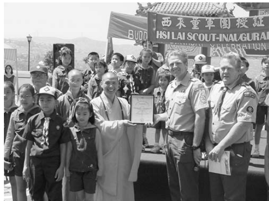
二〇〇一年，西來童軍團正式成立。

二〇〇一年「西來童軍團」正式成立，宗旨在於學習有紀律的團體生活、培養獨立自主的性格及領導力及引領融入當地社會服務大眾，同時藉由童軍團的訓練並透過淺顯漸近的方式，給予小朋友佛法的薰陶，培養兒童行善的習慣。亦希望透過此強大的主流團體，與主流社會接軌。