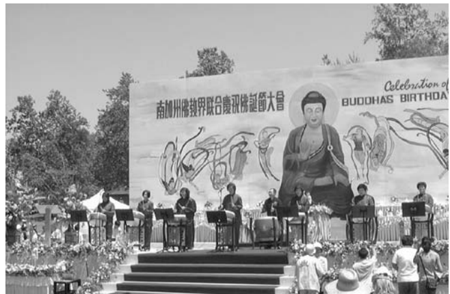
佛光鼓樂團發揚中華國粹，扮演文化交流之角色。