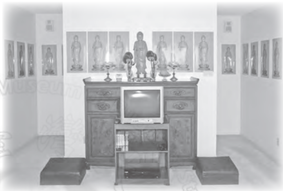
■ 佛陀淨宗學會佛堂

其四乃位於鄭家的佛教共修團體——「佛陀淨宗學會」，是一群行持淨土法門信眾的團體。鄭家數十年前來自越南，一家四口以聽淨空法師說法的錄音帶，逐漸進入佛陀世界，行持以念佛一門深入，十分虔誠。家門口掛