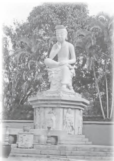
■ 石造半跏思惟菩薩像

無量寺的四大天王殿（見插圖），一如中國明清時代佛寺，位於正殿的前方，有趣的是，此天王殿兼具山門的造型與功能。若是日式曹洞宗與臨濟宗的禪寺山門，其門上通常另立鐘樓，