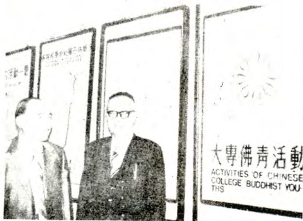
館物博又歷立國觀參長事董德宣周社本與(左)長院賢俊余院茶區 。麻專「動活青佛專大」展物文教佛