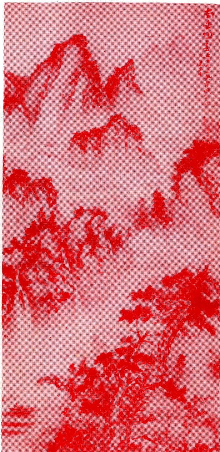
吳崇斌先生作品（山水畫） Landscape Pictures — By Mr. Ng Sung Bun