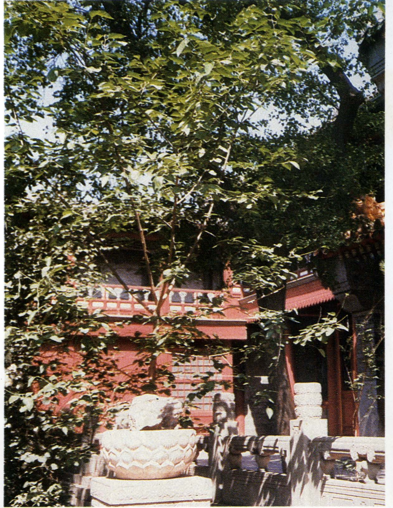
▷ 七葉桃——法源寺三寶之三