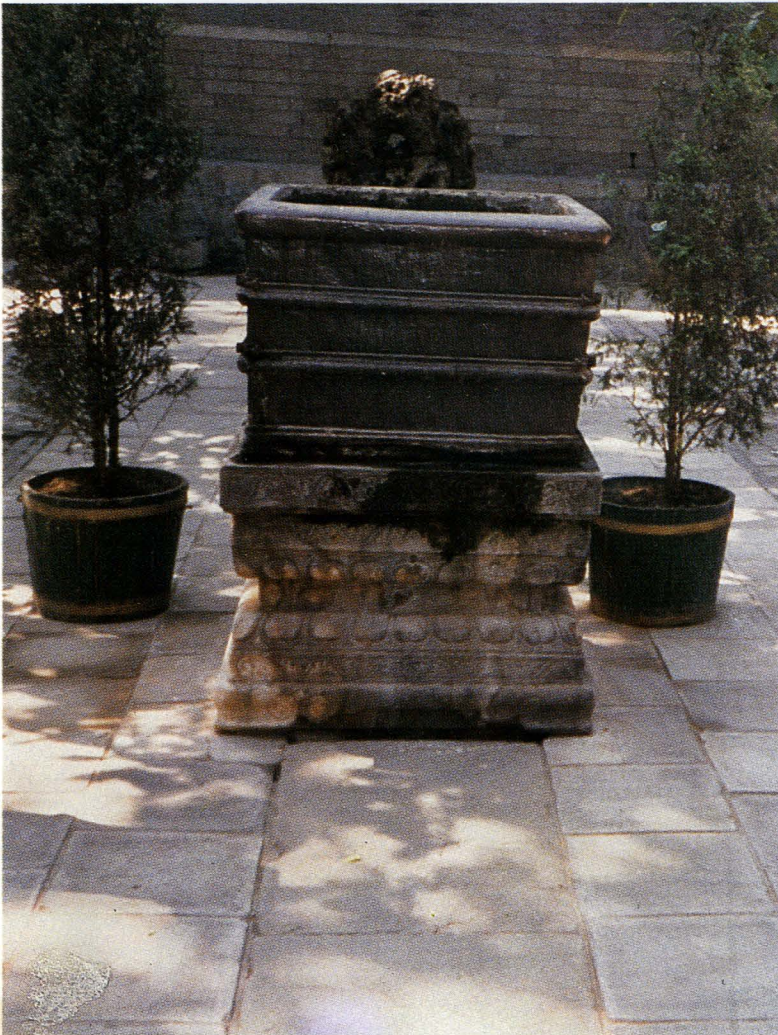
◁ 明代巨型方瓷缸——法源寺三寶之二