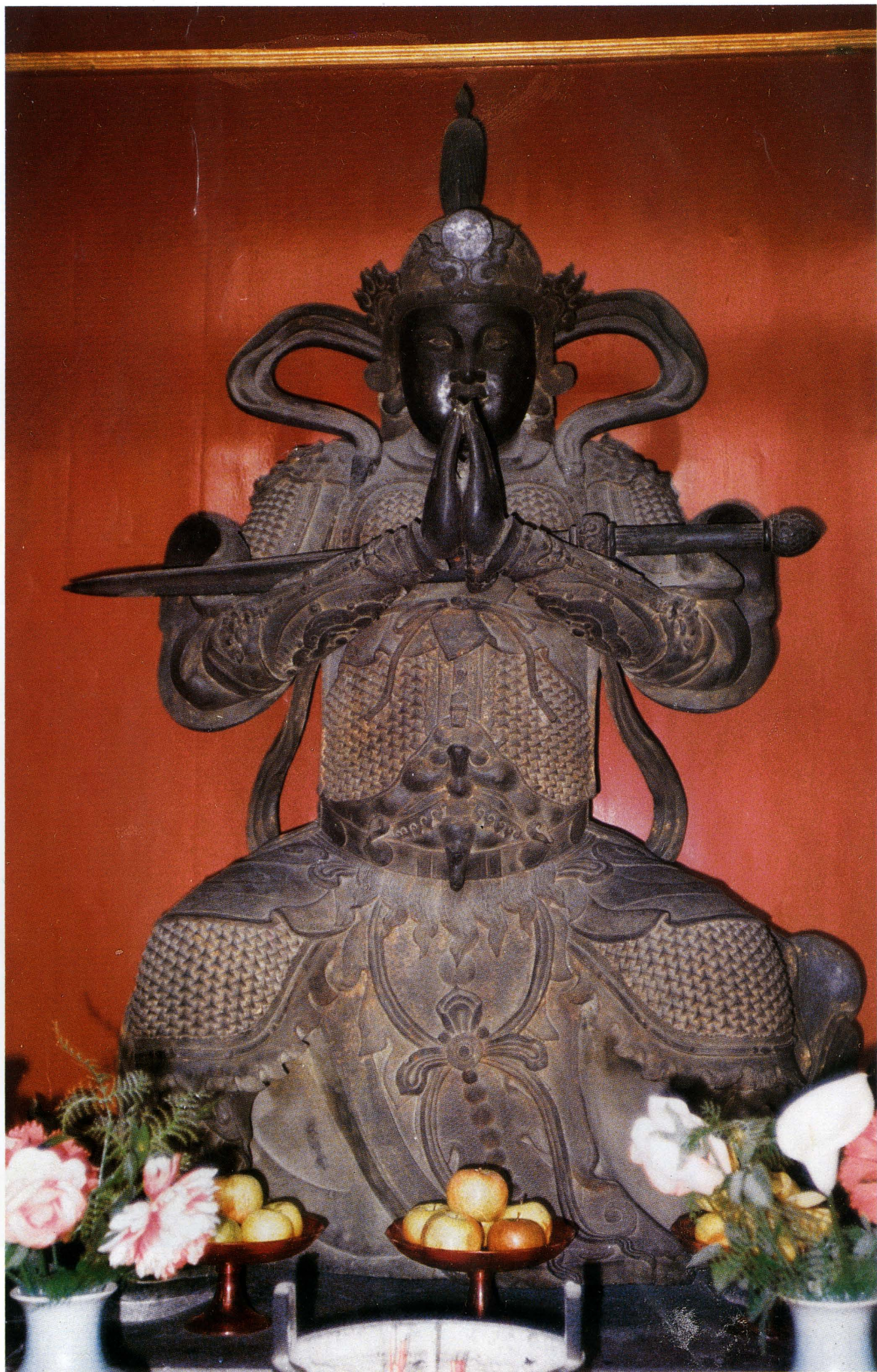
◁ 法源寺銅鑄韋陀菩薩像