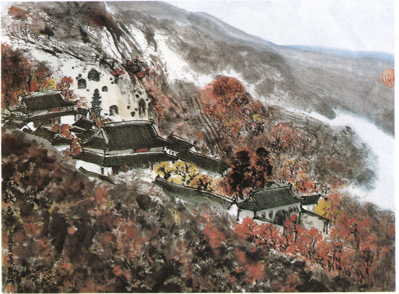
△ 亞明繪 棲霞山棲霞寺秋色