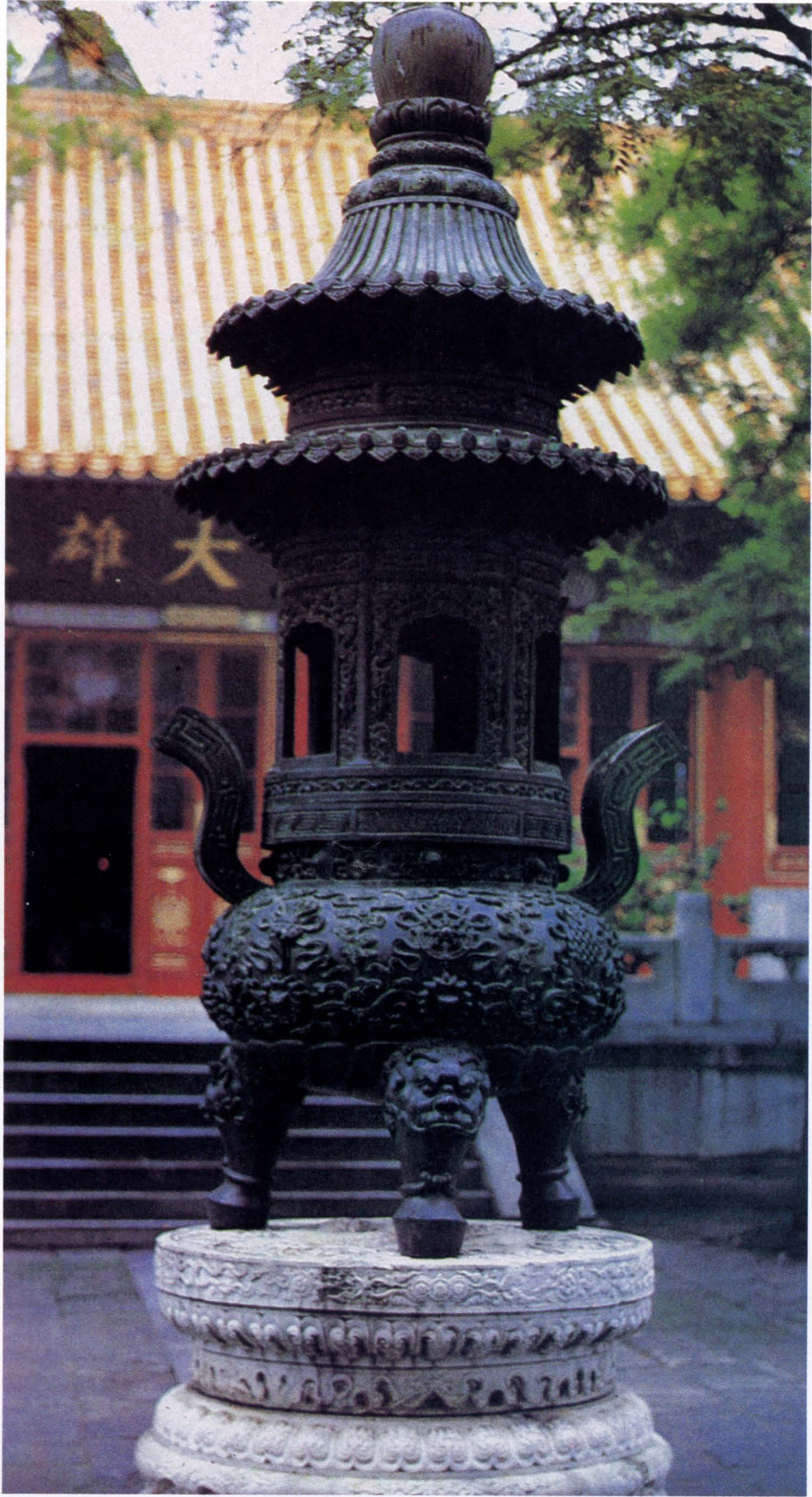
△大殿前的青銅寶鼎乾隆年間鑄成