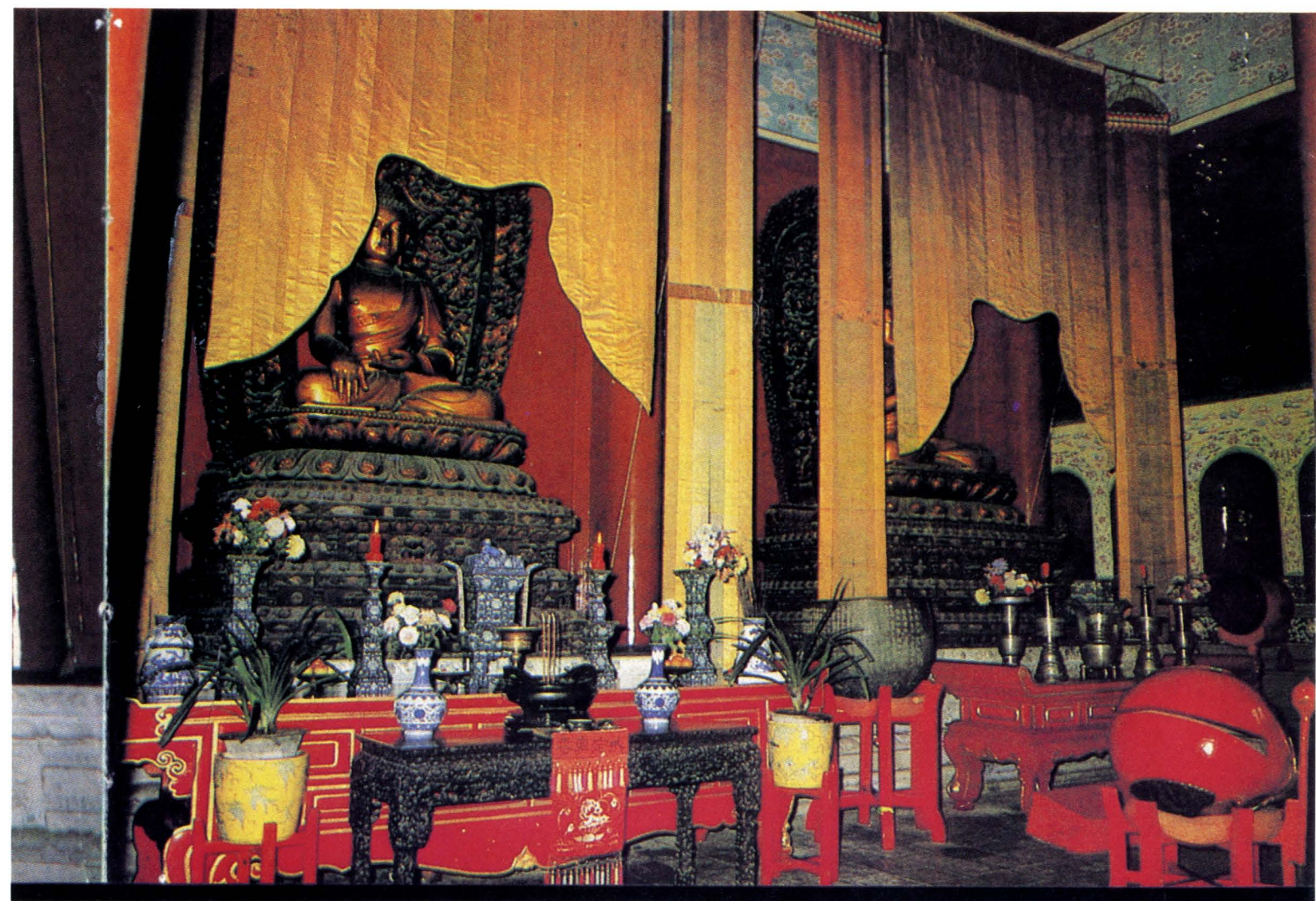
△大殿內的釋迦如來坐像