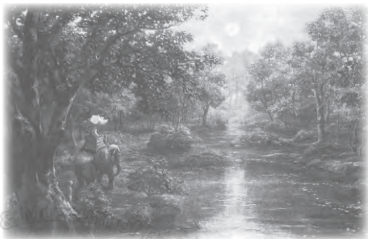
■ 走向藍毗尼園的摩耶夫人

題曰「大出離」的畫面，主要描述悉達多太子遠離皇宮尊貴生活，到阿奴摩河畔斷髮出家的情景。畫面中呈現出薄霧初溶、晨曦方露的大自然原野背景，在微光中，照映著白馬蹏陟、悉達多太子、侍者車匿依稀的形影。這幅的取景有別於他幅濃