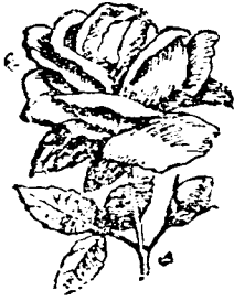
कुसुमम् kusumam 花