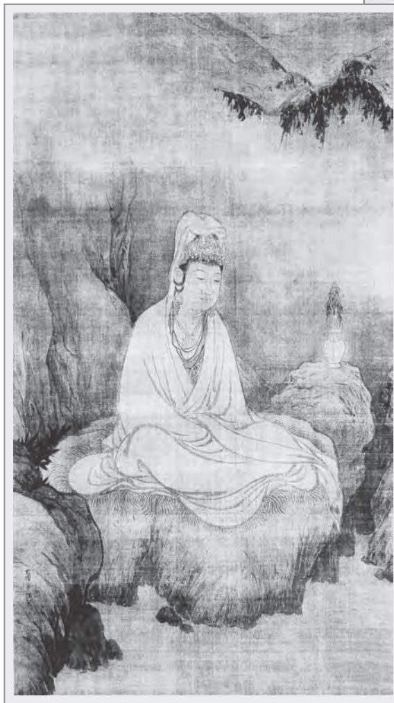
南宋牧溪「觀音猿鶴圖」

慈悲是使人趨向柔軟友善的氣質。慈是「與樂」，給予別人安樂；悲是「拔苦」，拔除他人的痛苦；與樂、拔苦合起來就叫慈悲。慈悲是不瞋恨、不惱害眾生，減少人與人的衝突、隔閡。人怎麼能做到不瞋恨、不惱害眾生呢？這必須透過禪修來淨化心靈，在經過淨化後，心靈自然地敞開，觀眾生猶如赤子，超越對立差別、超越種族、超越主義宗派、超越宗教差異、超越人我區隔，這時候心靈最健康，對人最信任，願分享修法的喜樂、深深為他人祈福：願眾生能脫離痛苦走上解脫之道，願眾生分享自己內心的平靜、安詳、喜樂，這就是慈悲觀。