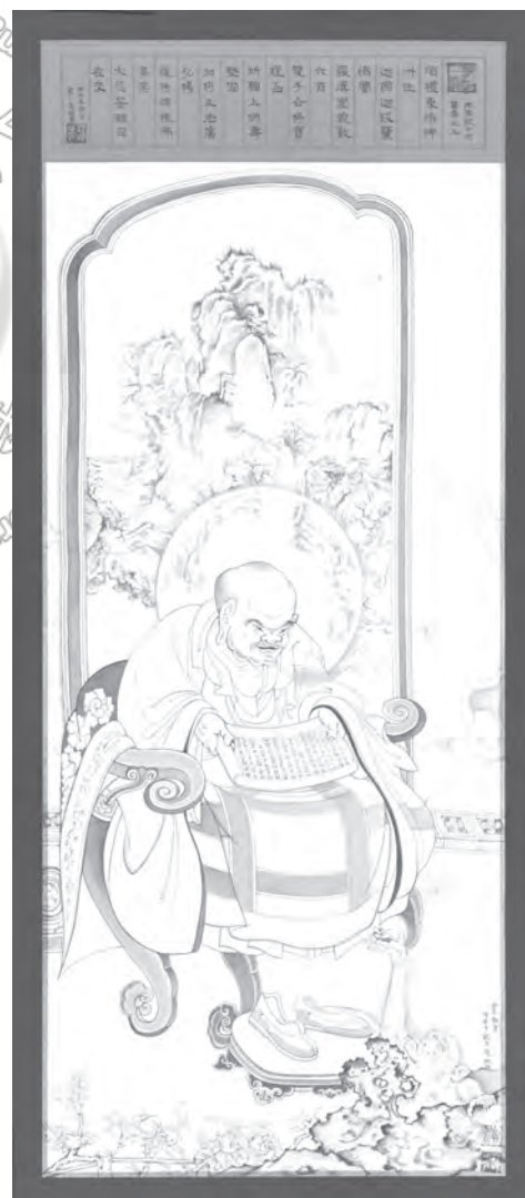
圖四：紀子亮畫羅漢