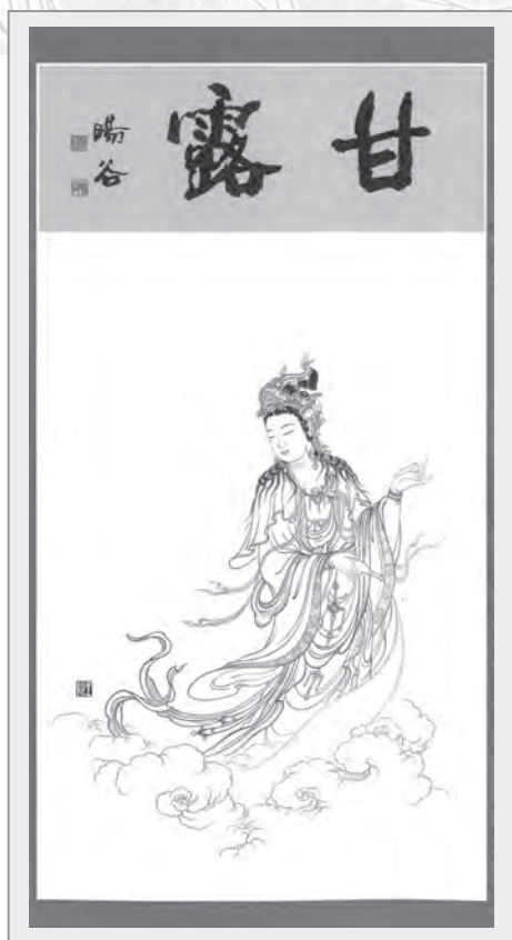
圖2：甘露觀音像

其中屬於釋迦牟尼佛的造型，恆是頂上高突的肉髻、身穿偏袒右肩的服飾，雙足結跏趺坐於盛開的蓮花座上。其手印是：右手筆直向下作觸地印（掌心向內），左手在腹前托鉢。觸地印是釋迦八相成道中的降魔相，托鉢表示仍在苦行，因降魔是釋迦如來得以成等正覺的關鍵過程，如「釋迦牟尼佛與八大成就者」一圖（圖3）。而「藥師佛壇城」一圖中藥師佛的手印造型，也同於釋迦。