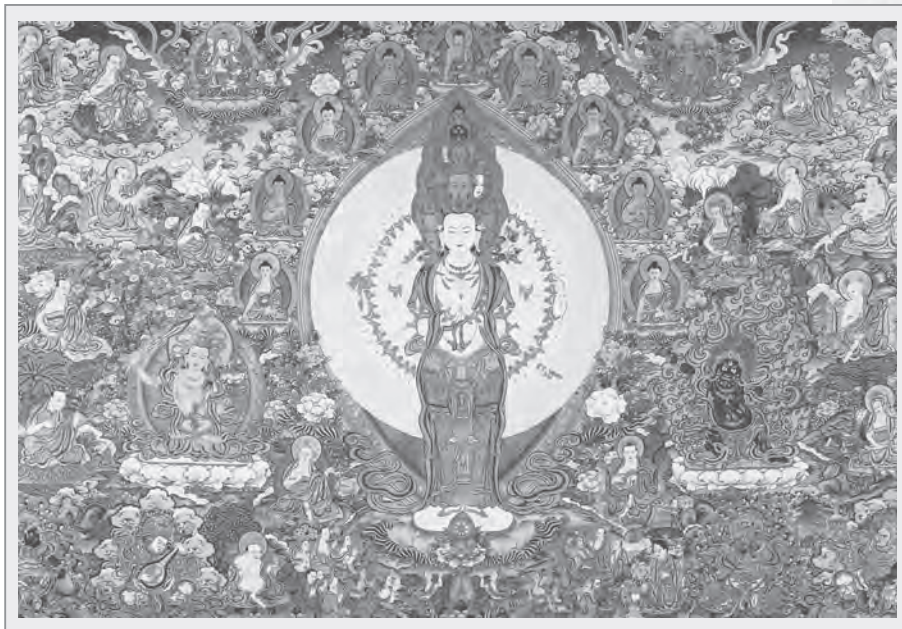
圖6：十一面千手千眼觀世音菩薩