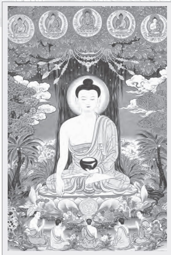
圖5：釋迦牟尼佛菩提樹下說法圖

藍文殊、白文殊、黃文殊等。其手印、持物、坐騎等，與主尊像稍有差別（圖7）。在展品中所出現的唐卡題材中，表現威武或憤怒形象者，如財寶天王與大威德金