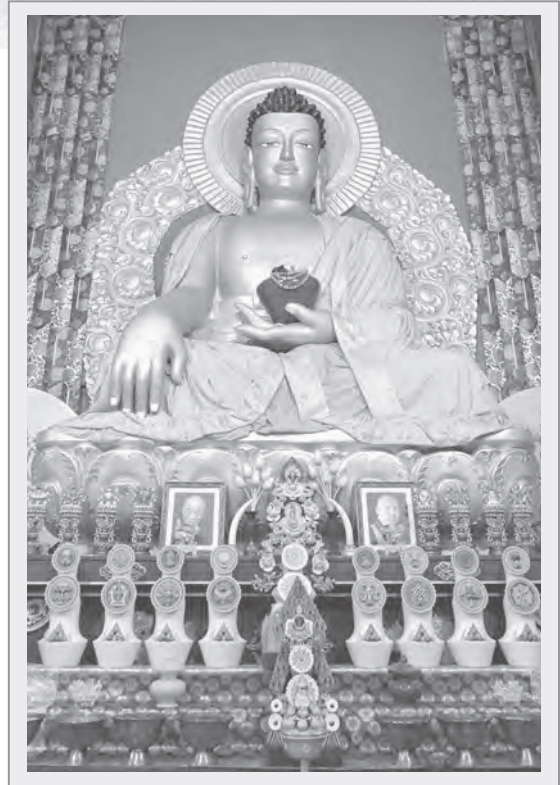
圖8：釋迦牟尼佛像，攝於金法林大殿

剛。前者雙目圓瞪，身穿黃金鎧甲，又掛滿飾物，其右手持勝幢，左手握鼬鼠，兩側有八馬財神，四周有四大天王。大威德金剛，上具怖畏九頭、水牛臉及二牛角，身有三十四手，各持不同法器，下身兩腿，但具十六足。