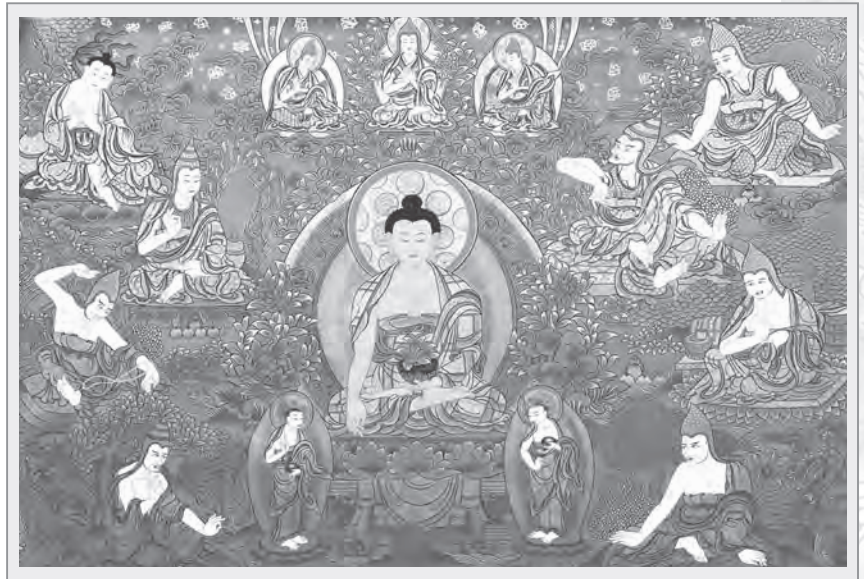
圖3：釋迦牟尼佛與八大成就者

而菩薩像的造型，外觀恆是頭戴寶冠，雙耳掛環，敞開前胸，瓔珞為飾，雙足結跏趺坐之姿。在多臂的觀音菩薩中，如四臂觀音以中央二手合掌於胸前，左外張手拈蓮花於耳際，右外張手持白色念珠，二外張手掌是指向本尊中心。而十一面千手千眼觀音菩薩，千手分數層環繞全身，正中層兩手合十當胸，摩尼寶珠握於掌心，次