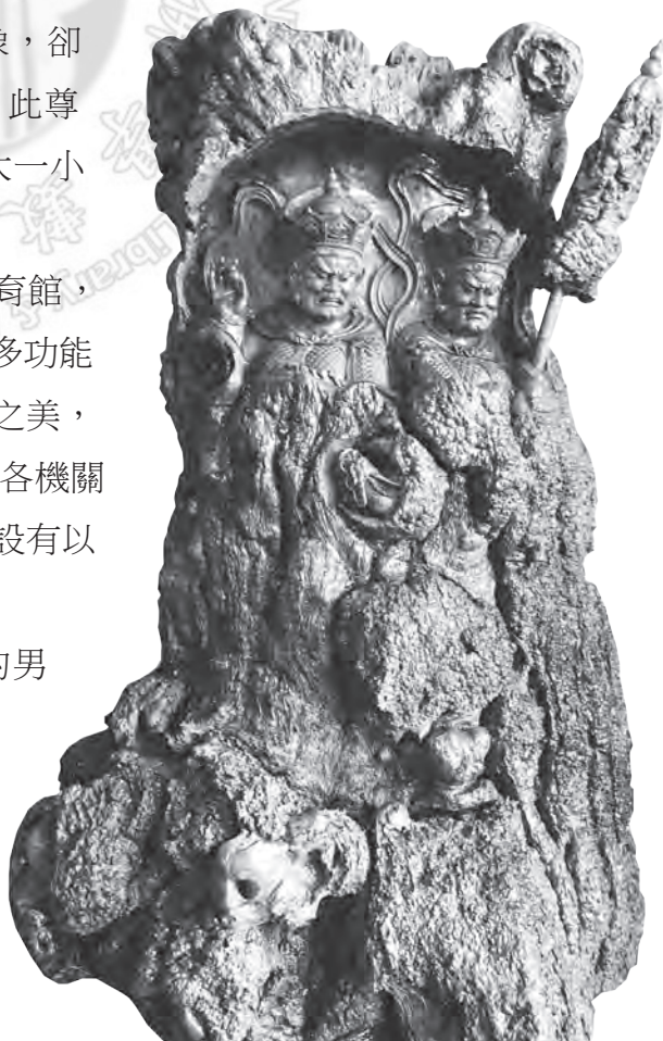
圖2：西方廣目天與北方多聞天

靠內側的展區，展示著排灣族與魯凱族的男女服飾。穿著服飾的模型，均頭戴羽毛冠，身穿鑲嵌著百步蛇紋的服飾，宛若真人。中央展區則展示著數尊木質雕刻人像，每像均