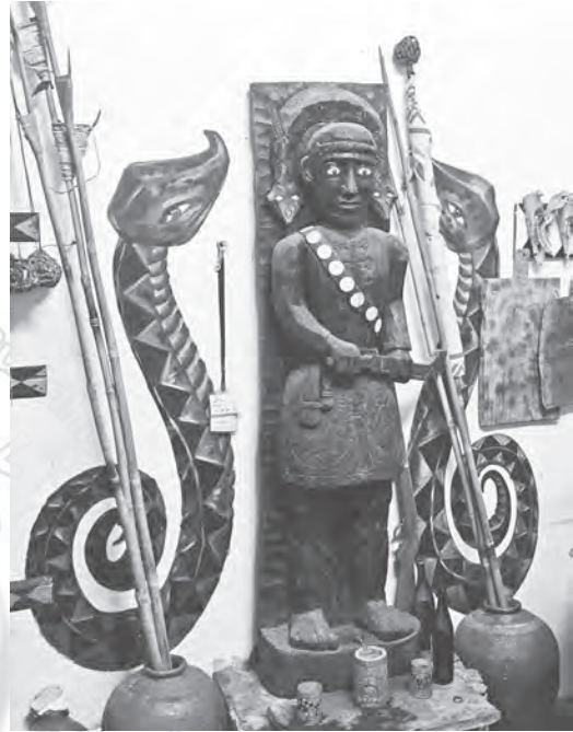
圖3：古家祖靈柱

以屋內中心祖靈柱而言，古家的祖靈柱（圖3），頭頂盤繞一雙百步蛇，尾端相接，雙蛇頭由兩耳側伸向兩肩，祖靈雙目大睜，神情嚴肅，上身穿中分