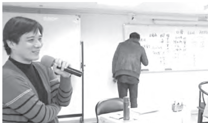
慧炬「開心玩寫作——心靈書寫與觀照」課程現場