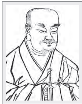
天台宗開山祖師智顛

在印度佛教傳入中國之初，即開始有經典的翻譯。起初中國佛教徒認為從印度或西域傳來的經論典籍，皆是佛陀金口所說，理無二致；但是到了魏晉南北朝，在