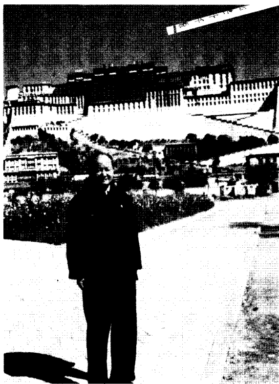
↑ 作者於布達拉宮前

藏傳佛教俗稱喇嘛教，喇嘛一詞，最早大約出現在元代，當時寫作「刺馬」，明代沿用，有時亦寫作「刺麻」或「喇嘛」，