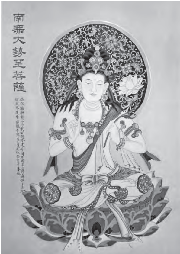
附圖2 大勢至菩薩像