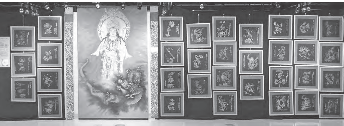
附圖5 大悲心陀羅尼經四十二手眼真言圖

圖中的如意珠手、寶弓手、寶經手、白蓮華手、青蓮華手、寶鐸手、紫蓮華手、葡萄手等，屬於摩尼部增益法，由諸煩惱滅除，定慧增長。